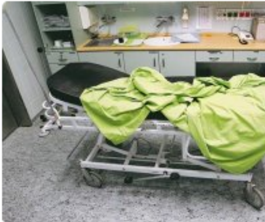
Minden ágy mellől hiányzik egy-két á

Népszabadság • Kun J. Viktória • 2008. május 16.